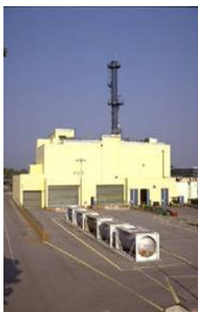
Conteneurs de nitrate d'uranyle et atelier de conversion TU5 à Pierrelatte

Ainsi à la demande du client EDF, une partie de cet URT est expédiée à l'étranger pour ré-enrichissement et réutilisation sous forme de combustible. En effet, AREVA ne dispose pas aujourd'hui des installations permettant le ré-enrichissement de l'URT.