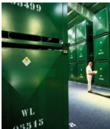
Entreposage d'Uranium appauvri à Bessines

AREVA a transféré la technologie de défluoration de l'uranium appauvri à la Russie et a construit une installation industrielle pour le combinat de Zelenogorsk (Russie), d'une capacité de 10 000 t UF 6 /an. Le début de la production est programmé dans les mois qui viennent.