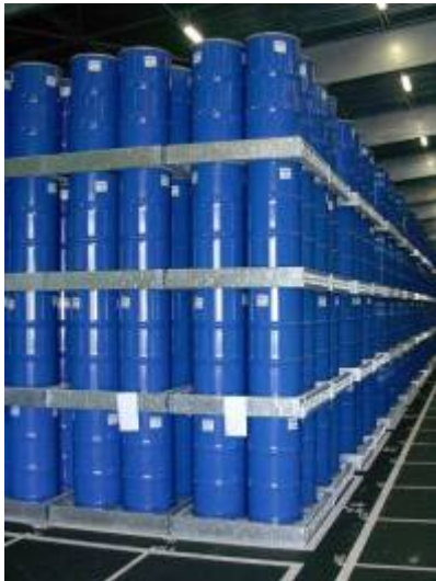
Entreposage sur le site du Tricastin

Ces conteneurs sont entreposés dans des bâtiments spécifiques sur le site du Tricastin (26).