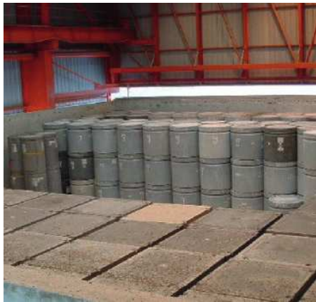
Stockage colis FMA-VC