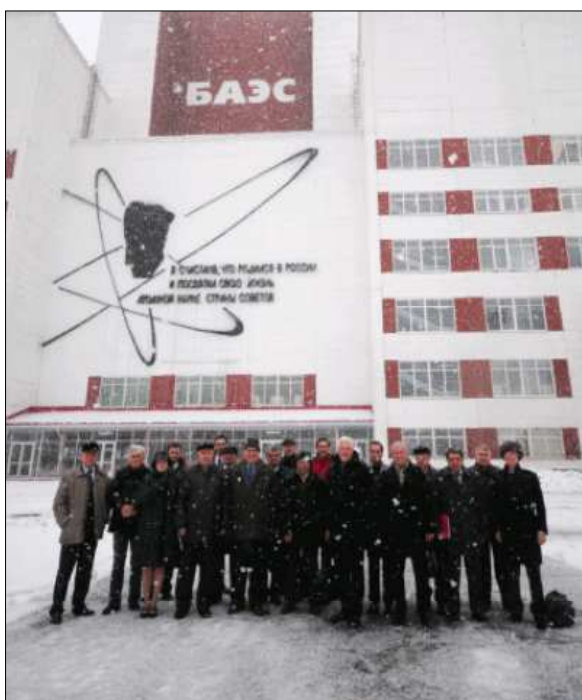
Délégation du Haut comité devant le réacteur BN-600 de la centrale de Beloïarsk située dans l'Oblast de Sverdlovsk (Oural)