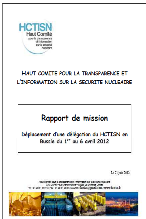
Rapport de mission suite au déplacement de la délégation en Russie

Le rapport de mission rédigé à l'issue de ce déplacement a fait l'objet d'une présentation et d'un échange avec les membres du Haut comité lors de la réunion plénière du 21 juin 2013. Il a ensuite été adopté formellement par le Haut comité et mis en ligne sur le site internet du Haut comité.