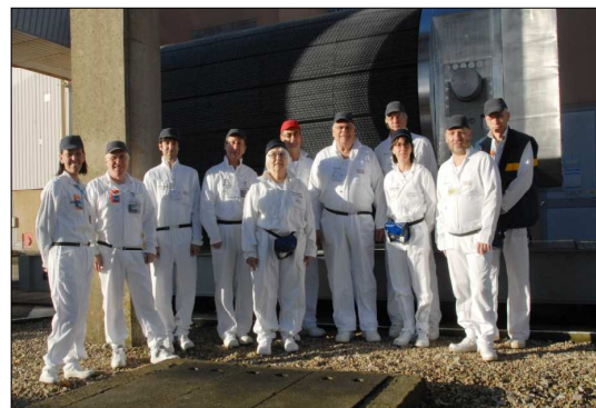
Visite du site de La Hague