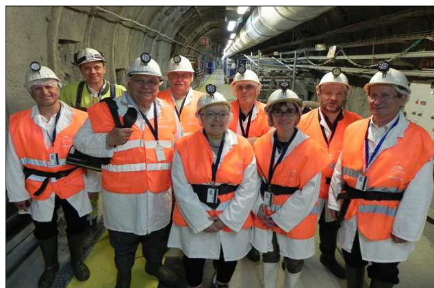
Visite d'une délégation du HCTISN au laboratoire souterrain de Bure

La délégation a également visité l'exposition "La radioactivité - de Homer à Oppenheimer", à Saudron (Haute-Marne), qui avait fait l'objet d'une présentation détaillée lors de la séance plénière du 15 septembre 2011.