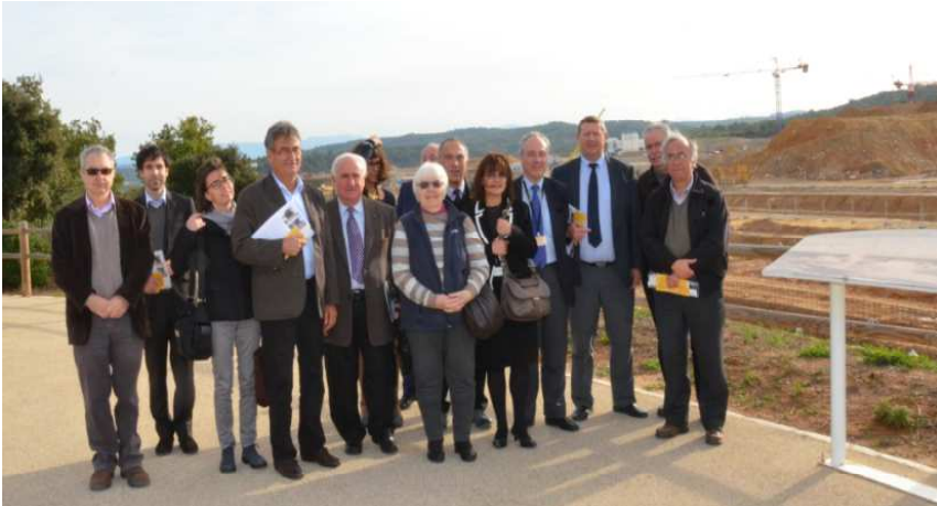
Rencontre de la délégation avec des responsables du projet ITER