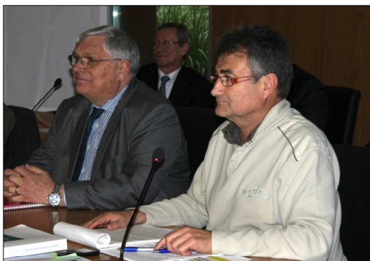
Table ronde site EDF de Flamanville