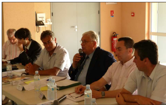
Table ronde site EDF de Golfech