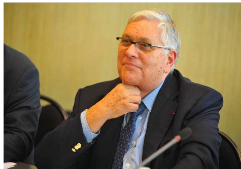
Henri REVOL – Président du HCTISN

Ce fut le cas lors de l'élaboration du rapport intitulé « contribution du HCTISN à la démarche relative aux évaluations complémentaires de sûreté des installations nucléaires françaises au regard des événements survenus à Fukushima », adopté le 13 décembre 2012 à l'unanimité des membres du Haut comité présents.