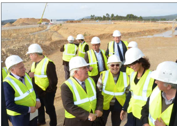
Visite du chantier de construction de l'installation ITER