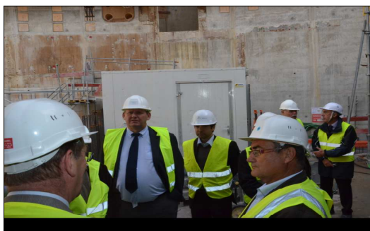
Visite du site sur le site du CEA de Cadarache